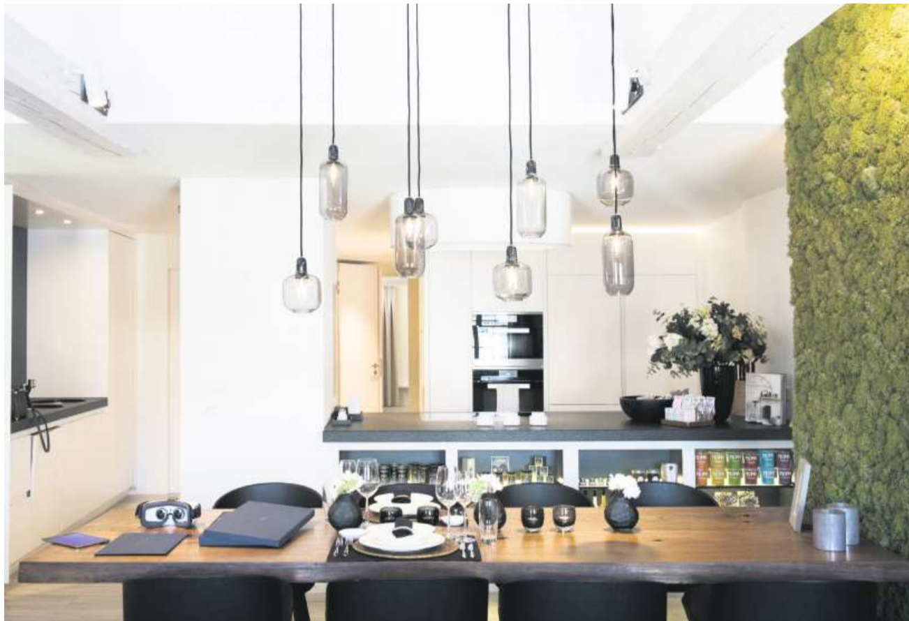
Das höchste Gericht gewichtet das Interesse an bezahlbarem Wohnraum höher als das der Kurzzeitvermieter.

Um diesem nachzukommen, lasse sowohl das Bundes- als auch das Kantonsrecht den Gemeinden Raum, um Massnahmen zu ergreifen. Die Regelungen haben nach Ansicht des Bundesgerichts auch den Zweck, die Wohnlichkeit der Stadtquartiere zu fördern. Business-Apartments führten durch ihre Befristung zu häufigen Mieterwechseln. Die hohe Fluktuation fördere tendenziell